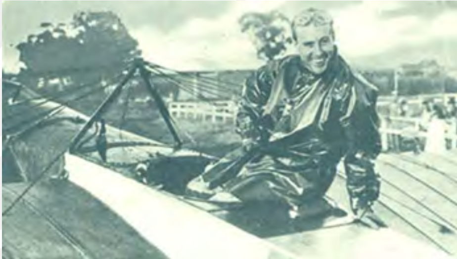
Jorge Alejandro Newbery fotografiado sobre su avión. Nació The Sportsman .

En disciplinas como el remo, acompañó en una prueba de dos remos largos, estableciendo poco tiempo después el récord de velocidad, en un bote de cuatro remos largos, acompañado por Lanusse, Van Praet, y Varas. En lucha grecorromana –sí, también– en octubre de 1903 venció al profesional Zavattaro. En 1906- ganó la regata organizada por el Tigre Sailing Club. ¿Algo más? Automovilismo. Montado en un Brasier de 120 HP, superó una velocidad de más de 133 kilómetros por hora.