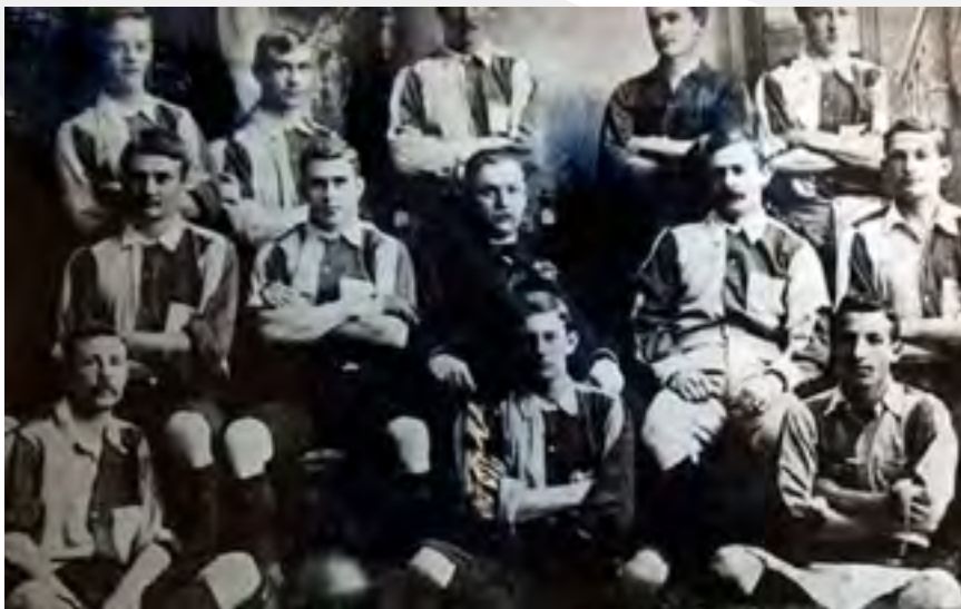
Imagen del primer equipo de fútbol en Argentina. El partido se disputó entre el equipo blanco y el colorado a mediados de mayo de 1867. Ambos equipos pertenecían al Buenos Aires FC y fue disputado 24 años antes del primer campeonato oficial.

Este contexto, social, político, económico, rodeado de grandes cambios, era también el inicio de una nueva era en la Argentina. El deporte comienza a tener mayor preponderancia, aparece el fútbol a mediados del siglo XIX de la mano del arribo de los inmigrantes británicos que llegaban a establecerse en el país, principalmente por la construcción de los ferrocarriles. Es allí que hace su aparición el fútbol, y aunque comenzó como un deporte practicado por unos pocos, con el correr del tiempo fue tomando popularidad hasta convertirse en un bien cultural como lo es en estos días. Otros deportes de la época también se lucían, entre ellos el boxeo, la esgrima y el remo por nombrar algunos.