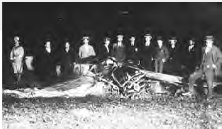
Restos de la nave que piloteaba Jorge A. Newbery, propiedad de Teodoro Fels.