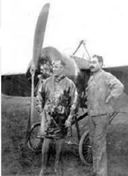
Imágenes de Jorge A. Newbery, posando al lado del Morane Saulnier de Teodoro Fels, antes de comenzar sus acrobacias y horas antes de su lamentable fallecimiento.

— Jorge, qué placer. Queremos verlo volar —dice una señorita.