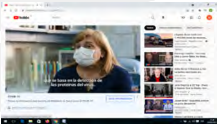
Figura 3: Fondo y Figura.

Su estructura audiovisual presenta una serie de variaciones con respecto al anuncio anterior, como por ejemplo los elementos que conforman la profundidad del campo fílmico (Figura 3).